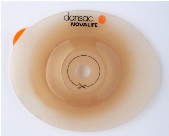
Nova 2 alaplap