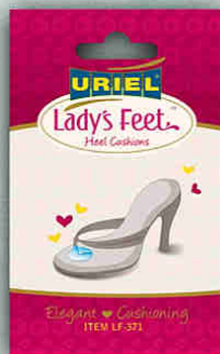
LF-371 Gélpárna lábujjközi papucshoz