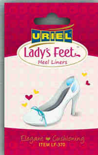
LF-370 Saroktartó cipőbélés tapasz