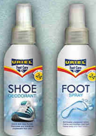
FC-331 Lábszagűző lábspray