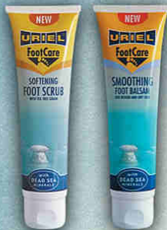
FC-313 Bőrpuhító lábbalzsam