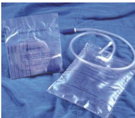
Urin 1,5 liter

A katéteren távozó vizelet gyűjtésére használt eszköz. Steril, egyszer használatos.