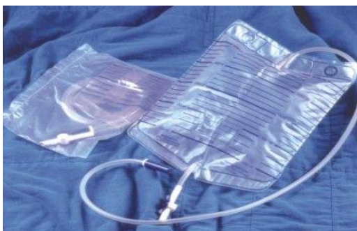
Urin 4 2 liter