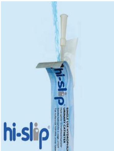
OEP támogatott termék

A HI-SLIP Plus egy húgyuti katéter, amelynek felületi bevonata PVP (polivinilpirrolidon) nevű anyag, mely vízzel érintkezve nagyon csúszóssá válik. Ezáltal a katéterezés könnyebbé, súrlódásmentessé tehető.