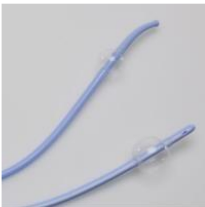
OEP támogatott termék

A Dover 100% szilikon Foley katéter egy tisztán szilikon Foley katéter dupla lumen szárral, proximális tölcsérrel, felfújó szeleppel és a disztális hegyén retenciós balonnal. Kizárólag vizeletdrenázs céljára. Rutinlecsapolásra javallott. Ellenjavallat: ismert vagy gyanított uretralis trauma.