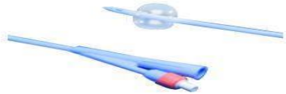
OEP támogatott termék