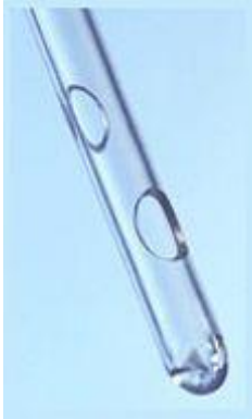
OEP támogatott termék

Bevezető katéter nők számára. A LoFric katétert könnyű felhelyezni és eltávolítani és ezért igen kíméletes a húgycsőhöz. Ez a katéter felületének köszönhető, amely nedves állapotban többségében vizet tartalmaz. A LoFric katétert használata során szinte csak a vízréteg kerül érintkezésbe a húgycső érzékeny nyálkahártyájával. A LoFric használatával elkerülhető a kellemetlen súrlódás és a külön síkosító anyag használata. A használatot megelőzően csak 30 mp-re vízbe kell helyezni a LoFric katétert. A katéter felszínén egy vízréteg alakul ki, amely a katéterezés során megmarad. Így a LoFric könnyedén csúszik befelé és kifelé is.