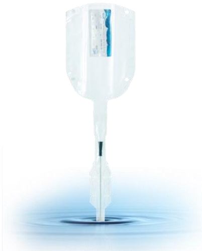
OEP támogatott termék

A LoFric Hydro-Kit egy három az egyben katéter-rendszer, amely egy katétert, egy vizet tartalmazó tasakot és egy vizeletgyűjtő zsákot tartalmaz. Főleg a kerekesszékes felhasználók találják kényelmesnek. A gyűjtőzsák ideálissá teszi a használatot az ágyhoz kötött betegek számára. A LoFric Hydro-Kit szabadságot és megnyugvást jelent a felhasználó számára, hiszen mindegy, hogy hol tartózkodik, mikor van szüksége katéterezésre, vagy, hogy van-e a közelben mosdó használati lehetőség. Férfi, női és gyermek méretben kapható.