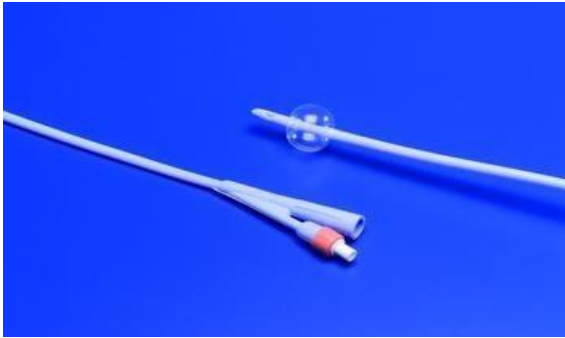
OEP támogatott termék

A Dover 100% szilikon Foley katéter egy tisztán szilikon Foley katéter dupla lumen szárral, proximális tölcsérrel, felfújó szeleppel és a disztális hegyén retenciós balonnal. Kizárólag vizeletdrenázs céljára. Rutinlecsapolásra javallott.