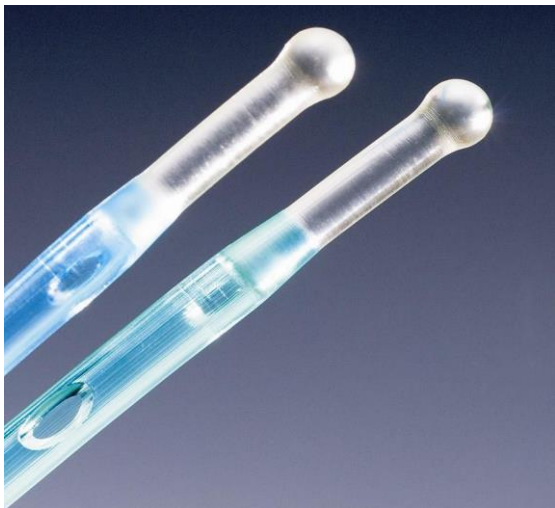
OEP támogatott termék

Hydrofil bevonatú 43 cm hosszú katéter férfiak számára. Az IQ-Catch szerkezete, 1: Gömbfej melynek kialakítása megakadályozza, hogy a katéter-fej a húgycsőben megakadjon és így sérülést okozzon. 2: Puha zóna. A gömbfej és a hajlékony előrész kombinációja lehetővé teszi, hogy az IQ-Catch erős nyomás nélkül is felcsússzon a húgycsőbe. 3: Lekerekített katéterszem. Kívül és belül egyaránt lekerekített, így kizárt az érzékeny húgycső-nyálkahártya bármilyen sérülése.