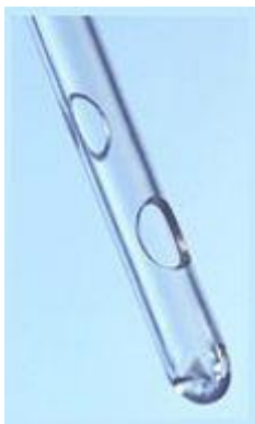
OEP támogatott termék

Bevezető katéter férfiak számára. A LoFric katétert könnyű felhelyezni és eltávolítani és ezért igen kíméletes a húgycsőhöz. Ez a katéter felületének köszönhető, amely nedves állapotban többségében vizet tartalmaz. A LoFric katéter használata során szinte csak a vízréteg kerül érintkezésbe a húgycső